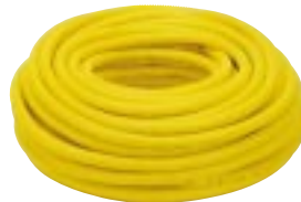
Eletroduto de PVC Flexível Corrugado