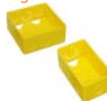
Caixa de Luz para Eletroduto Flexível Corrugado