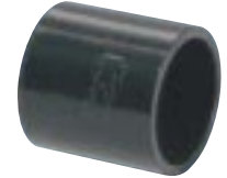
Luva para Eletroduto Soldável