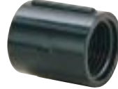
Luva para Eletroduto Roscável