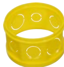
Prolongador para Caixa Octogonal