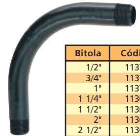
Curva 90° Longa para Eletroduto Roscável