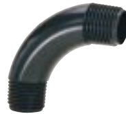
Curva 90° Curta para Eletroduto Roscável