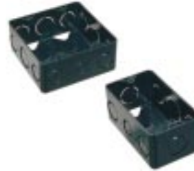
Caixa de Luz para Eletroduto Roscável