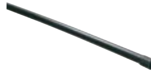
Eletroduto de PVC Rígido Soldável