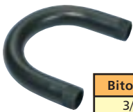
Curva 180° para Eletroduto Roscável