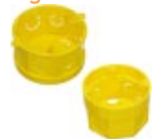
Caixa Octogonal para Eletroduto Flexível Corrugado