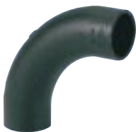
Curva 90° Curta para Eletroduto Soldável