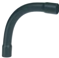
Curva 90° Longa para Eletroduto Soldável